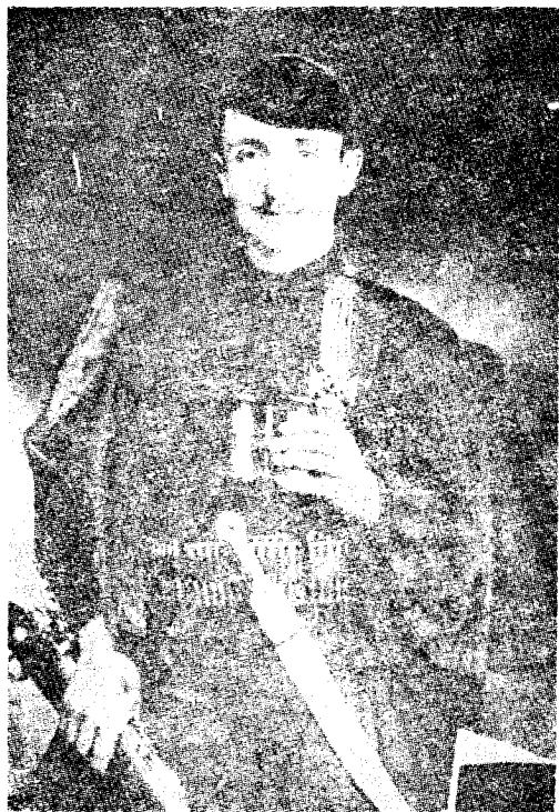
Νεαρός πολεμιστῆς Βορειοηπειρώτης ἐθελοντής.

— (Β)λιάσοβον (ἢ Λιάσεβον) — «Γερακάρα(—ι) — Σγοραλέτση (—ι) — Κοβατοσίτση — Πέστανη). Σ' αὐτὰ πρέπει νὰ προστεθῆ καὶ ἡ κωμόπολις Λεσκοβίκι, ἡ ὁποία ἀναφέρεται στὴν παραπάνω σελίδα (28) τῶν ἐπιστρατευτικῶν αὐτῶν Καταστάσεων.