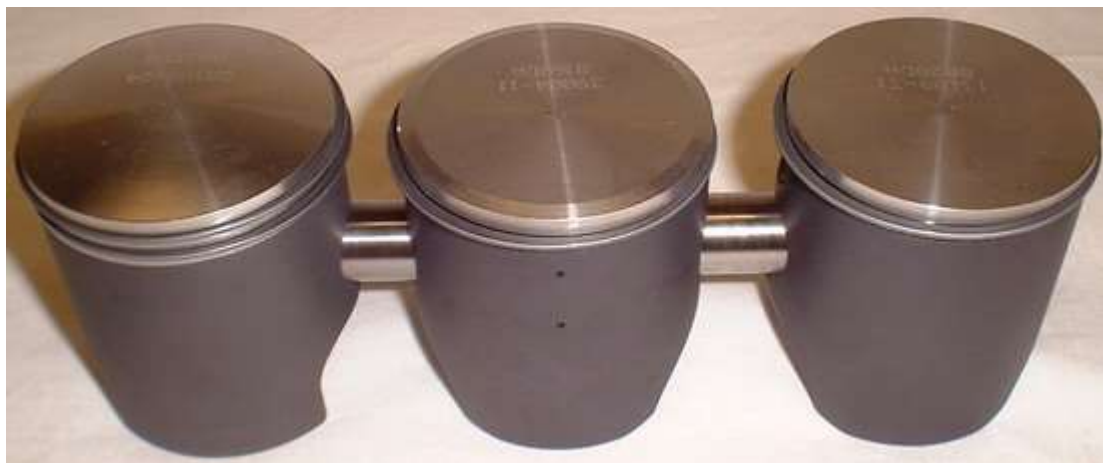
VRM Zündapp KS-125 Specialkolvar. Se längre ner!