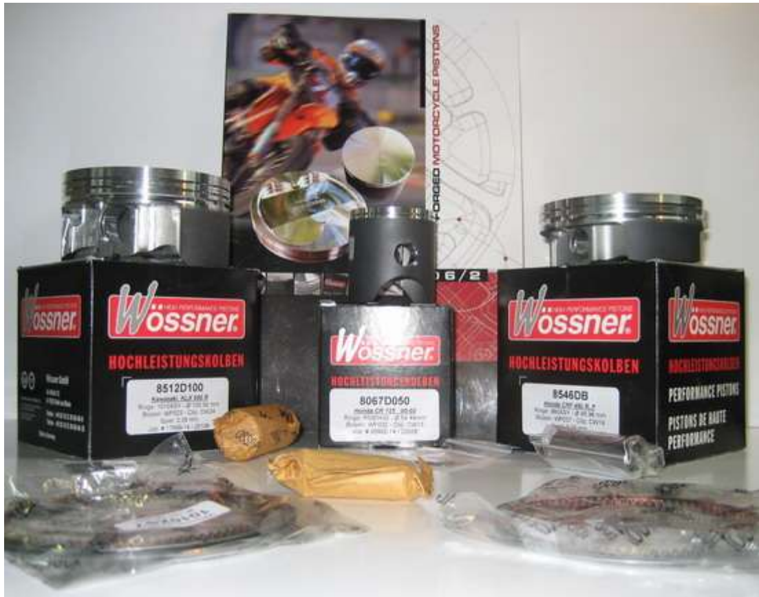
Wössner smidda och friktionsbehandlade kolvar