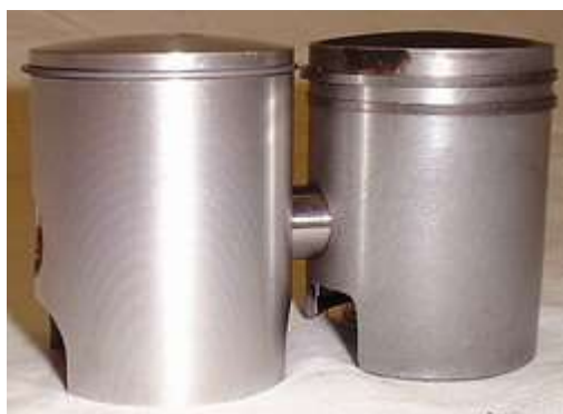
Bilden visar en Barikit racingkolv till vänster, och en Sachs standardkolv till höger.

Ring eller skriv så tar vi ett snack om vad som kan vara rätt just för Din motor! Fabrikat som BARIKIT MAHLE och KITACO