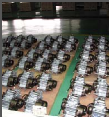
Όλοι οι κινητήρες, αφού συναρμολογηθούν και δοκιμαστούν, συγκεντρώνονται σε έναν ειδικό χώρο, και στη συνέχεια μεταφέρονται στη γραμμή τελικής συναρμολόγησης. Οι συγκεκριμένοι έχουν περάσει επιτυχώς τον έλεγχο