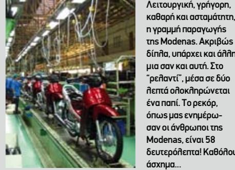
Λειτουργική, γρήγορη, καθαρή και ασταμάτητη, η γραμμή παραγωγής της Modenas. Ακριβώς δίπλα, υπάρχει και άλλη μια σαν και αυτή. Στο "ρελιαντί", μέσα σε δύο λεπτά ολοκληρώνεται ένα παπί. Το ρεκόρ, όπως μας ενημέρωσαν οι άνθρωποι της Modenas, είναι 58 δευτερόλεπτα! Καθόλου άσχημα...