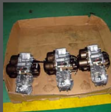
Αντίθετα, αυτοί οι τρεις απέτυχαν. Θα οδηγηθούν σε ένα ειδικό τμήμα του εργοστασίου, όπου θα αποσυναρμολογηθούν και θα επισκευαστούν. Το 99% των περιπτώσεων, οφείλεται σε προβληματικά ρουλεμάν. Πάνω στα χάρτινα ταμπλάκια, αναγράφονται τα ακριβή σκόλια του δοκιμαστή