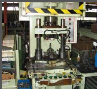
Σε αυτήν την υδραυλική πρέσα, πρεσάρονται τα ρουλεμάν και το γρανάζι της καδένας του εκκεντροφόρου, πάνω στον στρόφαλο. Αμέσως μετά, ακουμπεί το ζύγισμα