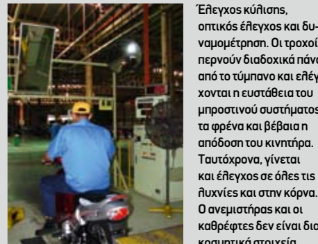
Έλεγχος κύλισης, οπτικός έλεγχος και δυναμόμετρηση. Οι τροχοί περνούν διαδοχικά πάνω από το τύμπανο και ελέγχονται η ευστάθεια του μπροστινού συστήματος, τα φρένα και βέβαια η απόδοση του κινητήρα. Ταυτόχρονα, γίνεται και έλεγχος σε όλες τις λυχνίες και στην κόρνα. Ο ανεμιστήρας και οι καθρέφτες δεν είναι διακοσμικά στοιχεία...