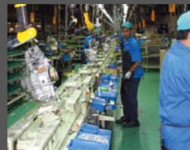
Γραμμή συναρμολόγησης κινητήρα. Ο κάθε εργαζόμενος έχει στη διάθεσή του συγκεκριμένο χρόνο και χώρο. Οι βάσεις όπου τοποθετούνται οι κινητήρες, αφού "κλείσουν" τα κάρτερ, έχουν τρισδιάστατη δυνατότητα κίνησης, διευκολύνοντας απίστευτα τη διαδικασία της συναρμολόγησης