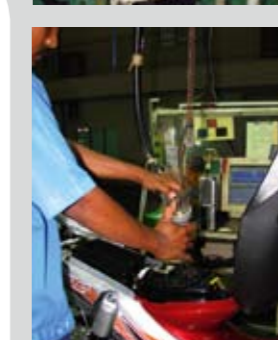
Αφού όλα τα στάδια ολοκληρωθούν, προστίθεται λίγο καύσιμο και το κάθε παπί οδηγείται στο δυναμόμετρο