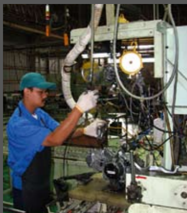
Στο τέλος της γραμμής, συνδέονται το καρμπυρατέρ, η εξάτμιση και τα ηλεκτρικά, και μέσα σε ελάχιστο χρόνο ο τεχνικός της φωτογραφίας ελέγχει αν ο κινητήρας τηρεί τις προδιαγραφές