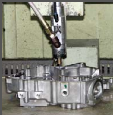
Η επεξεργασία του αριστερού κάρτερ του κινητήρα έχει ολοκληρωθεί. Διακρίνονται η τάπα του λαδιού και οι βάσεις του μαρσιπέ. Το συγκεκριμένο μηχανήμα, απλώνει αυτόματα φλατζόκολλα στις επιφάνειες των κάρτερ! Όπου χρειάζεται και όση χρειάζεται!! Να υπήρχε και σε φορτηγό!