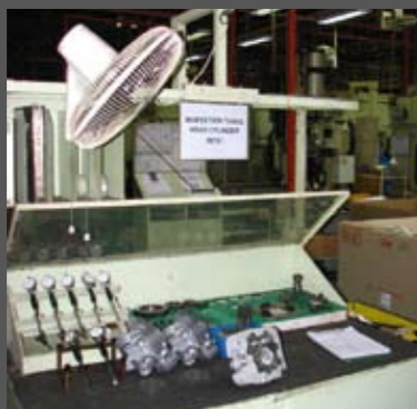
Τα περισσότερα εξαρτήματα του κινητήρα, δειγματοληπτικά, περνούν και από ανθρώπινο έλεγχο. Η ζέστη, είναι κάτι που δύσκολα μπορείς να καταπολεμήσεις στους ακανείς χώρους ενός εργοστασίου, πόσο μάλλον όταν αυτό βρίσκεται στην καυτή Μαλαισία. Απαραίτητο αξεσουάρ, ο ανεμιστήρας...