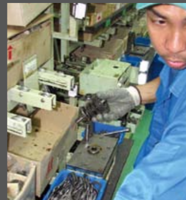
Συναρμολόγηση κιβωτίου. Μέσα σε ελάχιστα δευτερόλεπτα, και σχεδόν στα τυφλά, ο κύριος της φωτογραφίας συναρμολογεί ένα ολόκληρο κιβώτιο ταχυτήτων, από το μηδέν. Ο γρηγορότερος του εργοστασίου και με διαφορά!