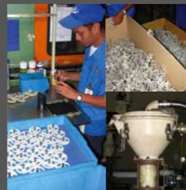
Εδώ κατασκευάζονται τα πλαστικά εξαρτήματα του κινητήρα, και στη συγκεκριμένη φάση, το πλαστικό γρανάζι της τράμπας λαδιού. Το πρωτογενές υλικό είναι σε στεγνή μορφή. Το περίεσομα, και τα καλούπια, ξαναχρησιμοποιούνται. Ο τεχνικός τοποθετεί τον μεταλλικό άξονα στο κέντρο του γραναζιού