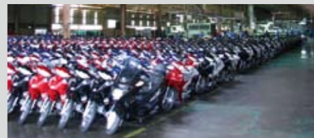
Στοιχισμένα, φρεσκοβαμμένα και πεντακάθαρα, μερικές εκατοντάδες παπιά περιμένουν να αναχωρήσουν από το εργοστάσιο της Modenas

με τα δικά μας δεδομένα), και είναι σχετικά αποκομμένο από την κοντινότερη πόλη ή χωριό της περιοχής. Η κτιριακή υποδομή του εργοστασίου ολοκληρώθηκε πριν από δώδεκα χρόνια, άρα μπορούμε να μιλάμε για ένα καινούριο, σύγχρονο κτίριο. Στον ίδιο χώρο και σε παραπλήσια κτίρια με του κυρίως εργοστασίου, βρίσκονται συγκεντρωμένα και όλα τα γραφεία της εταιρείας. Οι βιομηχανι-