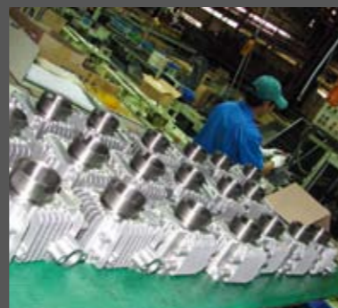
Αερόψυκτοι τετράχρονοι κύλινδροι, έτοιμοι και φρεσκοβαμμένοι, αναμένουν καρτερικά το στάδιο του ρεκτιφίε