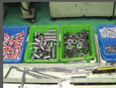
Βρισκόμαστε στο στάδιο όπου "κλείνουν" τα κάρτερ του κινητήρα. Σε πρώτο πλάνο, βίδες και εξαρτήματα "πρώτης γραμμής", που φτάνουν έτοιμα στο εργοστάσιο. Οι βίδες στα αριστερά, είναι οι "κόντρες" του ελατηρίου του επιλογέα ταχυτήτων. Το κόκκινο είναι κόλλα. Πιο δεξιά βλέπουμε spacers και ατσάλινες, παχιές ροδέλες για την καμπίνα του συμπλεκτή. Στα δύο μικρά μπλε δοχεία, διακρίνονται οι κατασβιδόβιδες που σφίγγουν τα κάρτερ, ενώ από κάτω τις σφίνες του βολάν