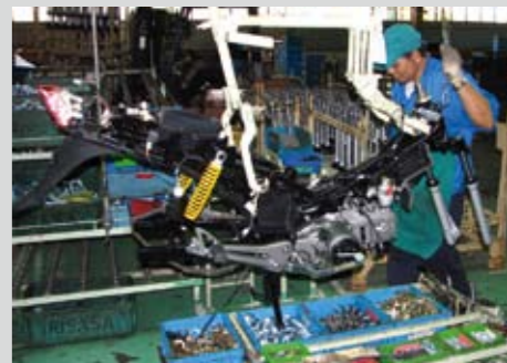
Βρισκόμαστε στην τελική γραμμή παραγωγής. Πρώτα τοποθετούνται η πλεξούδα και το κεντρικό στάντ. Αμέσως μετά ο κινητήρας και στη συνέχεια οι αναρτήσεις, οι τροχοί, το τιμόνι, τα περιφερειακά και τα πλαστικά. Εξαιρετικά ενδιαφέρουσα είναι η διαδικασία τοποθέτησης των ρουλεμάν του πλαίσιου. Σε δεύτερο πλάνο διακρίνονται οι "χύμα" μπιλίτες. Με τη βοήθεια ενός μαγνήτη και αρκετού γράσου, με ελάχιστες κινήσεις τοποθετούνται στη θέση τους