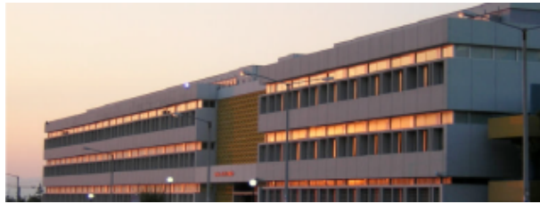
Το κτήριο του Τμήματος Μαθηματικών