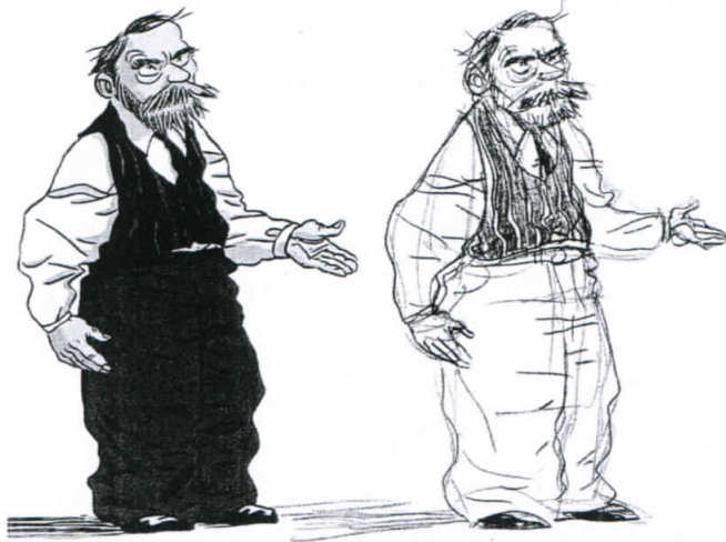
Αδμοσιεύτου σκίτσο του Γκότλομπ Φρέγκε από τον Αλ. Παπαδάτο, από τα υπόλοιπα του Logicomix .

Η προσπάθεια σύνδεσης του Φρέγκε με τον γερμανικό ιδεαλισμό σκοντάφτει και στην επιμονή του Φρέγκε στην αναλυτικότητα της αριθμητικής. Ο Σλούγκα υποτιμά την εμμονή στην αναλυτικότητα (που υποδηλώνει τις λαϊμπνιτσιανές καταβολές του Φρέγκε) και τονίζει την εμμονή του Φρέγκε στην απριορικότητα της αριθμητικής. Όπως όμως λέει, «δεν θα πρέπει να παραβλέψουμε το γεγονός ότι [ο Φρέγκε] και από τους δύο [Λάμπνιτς και Καντ] αντλεί με επιλεκτικό μονάχα τρόπο» (σ. 164). Ακριβώς. Αυτό, κατά τη γνώμη μου, δείχνει και τη ματαιότητα της προσπάθειας να