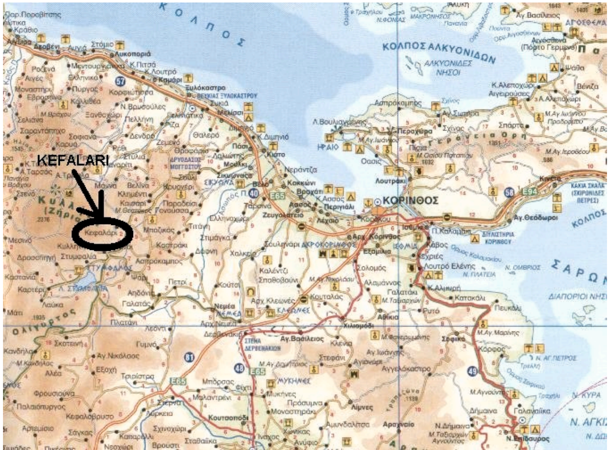
Σχήμα 2: Χάρτης Κορινθίας