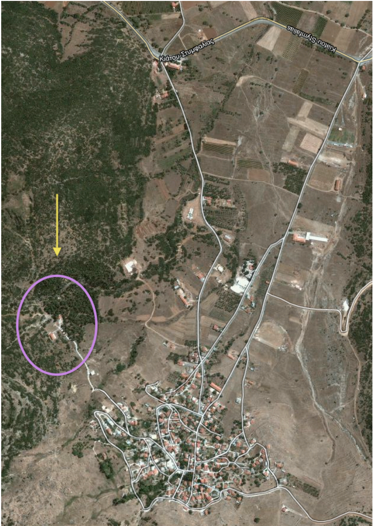
Σχήμα 4: Κεφαλάρι