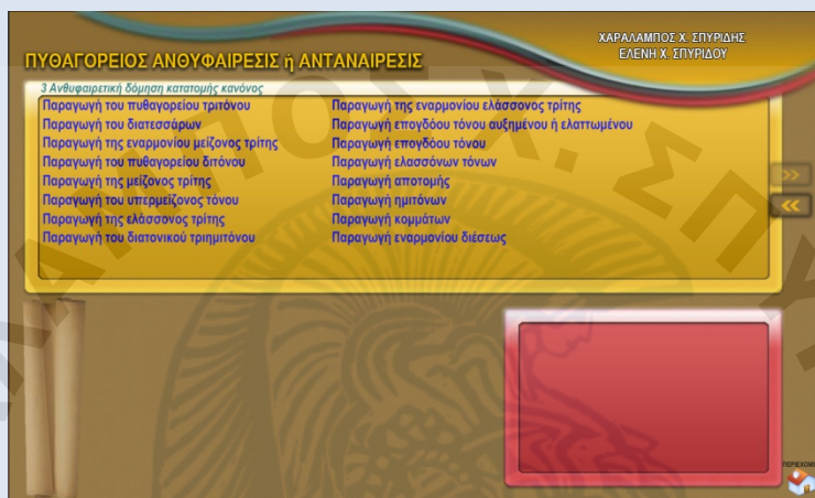
Εικόν 1: Τα τρία επίπεδα εις τα οποία χωρίζεται το αισθητικώς ελκυστικόν interface: οι δύο πίνακες (πρωτεύων και δευτερεύων) και ένας ανοιγοκλειόμενος πάπυρος.

Το interface είναι ελκυστικόν αισθητικώς με τα έντονα χρώματά του και πρακτικώς φιλικόν με τις εναλλαγές των μερών, τα οποία το απαρτίζουν. Χωρίζεται εις τρία επίπεδα: δύο πίνακες (κίτρινος και κόκκινος) και εις έναν πάπυρον.