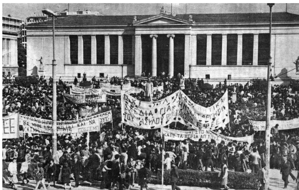
Εικ. 4. Από τις φοιτητικές κινητοποιήσεις του 1979 για την απόκρουση του νόμου 815 - ένθετη φωτογραφία στο τεύχος με το νόμο 1268.