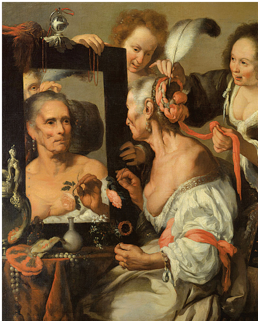
Bernardo Strozzi - Vanitas (Old Coquette) 1637