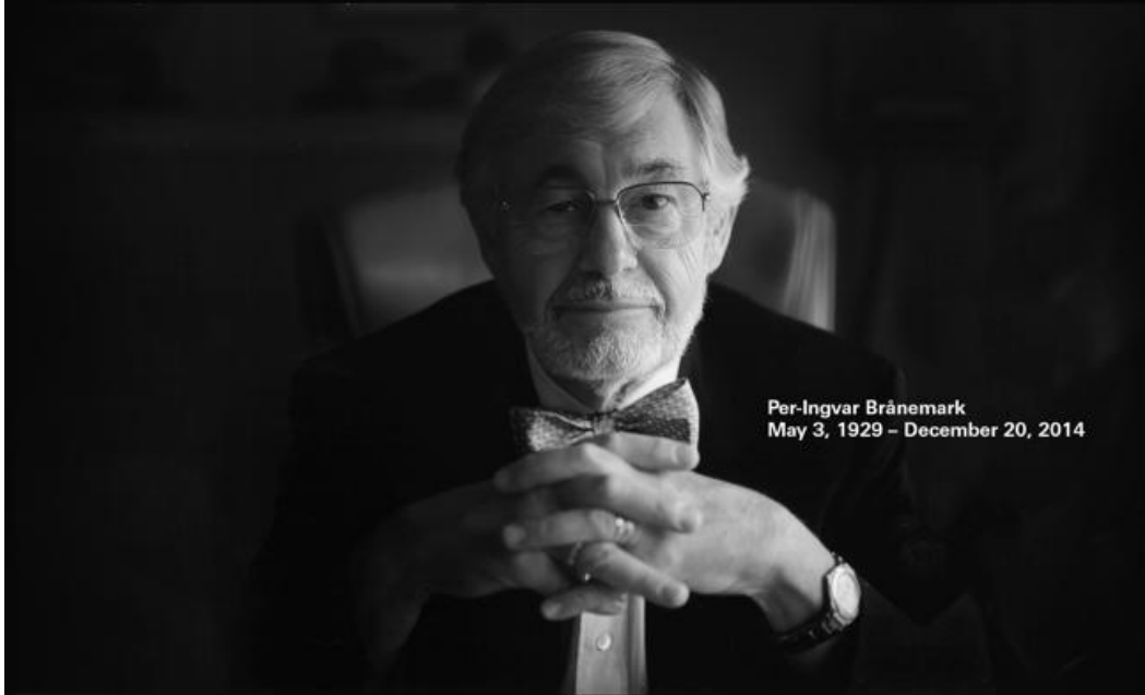
Per-Ingvar Brånemark May 3, 1929 – December 20, 2014

“Surround yourself with some of the best minds in the field, and you’re bound to succeed.” — Per-Ingvar Brånemark