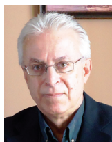
Ηρακλής Καρακάζης Ομότ. Καθηγητής Κινητής Προσθητικής ΕΚΠΑ

Γηροδοντιατρικός ασθενής 75 ετών, πλήρως αυτοεξυπηρετούμενος με άριστη κινητικότητα, φαρμακευτική αγωγή συνήθη για την ηλικία του, χωρίς ορατή γνωσιακή έκπτωση ή άλλες σοβαρές αισθητηριακές ανεπάρκειες 1 . Η ενδοστοματική εξέταση αποκαλύπτει κατάρρευση γέφυρας μικτής στήριξης (23-27) λόγω τερηδονισμού του πρόσθιου οδοντικού κολοβώματος ( Εικ. 1 ). Η αριστερή πλευρά ήταν και η προτιμώμενη πλευρά μάσησης (preferred chewing side)