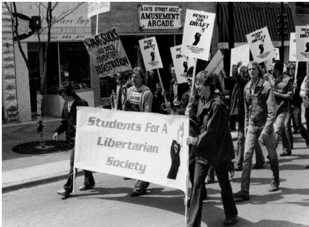
1965. Διαδήλωση φοιτητών του Πανεπιστημίου του Σικάγου κατά του πολέμου στο Βιετνάμ.

Αν λοιπόν, αγαπητή αναγνώστρια και αγαπητέ αναγνώστη, θέλεις να μάθεις κάτι για τη Σχολή του Σικάγου σίγουρα δεν θα το βρεις στο πόνημα της κυρίας Κλάιν. Αν δεν θέλεις να διαβάσεις ένα φιλικό προς το Σικάγο κείμενο 12 αλλά μια συλ-