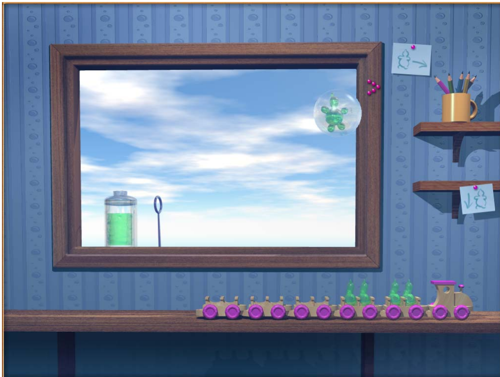
Εικόνα 2. Παράδειγμα άσκησης ελέγχου του ύψους της φωνής. Η φούσκα ανεβαίνει όταν αυξάνεται το ύψος φώνησης αλλά χάνεται αν το ύψος ξεφύγει από τα προκαθορισμένα όρια. Αν ανέβει αρκετά ώστε να πετύχει το βέλος στο κούφωμα, τότε σκάει και το ανθρωπάκι κάθεται στο τρενάκι. Μετά από αρκετές επιτυχίες δίνεται μια οπτική ανταμοιβή.