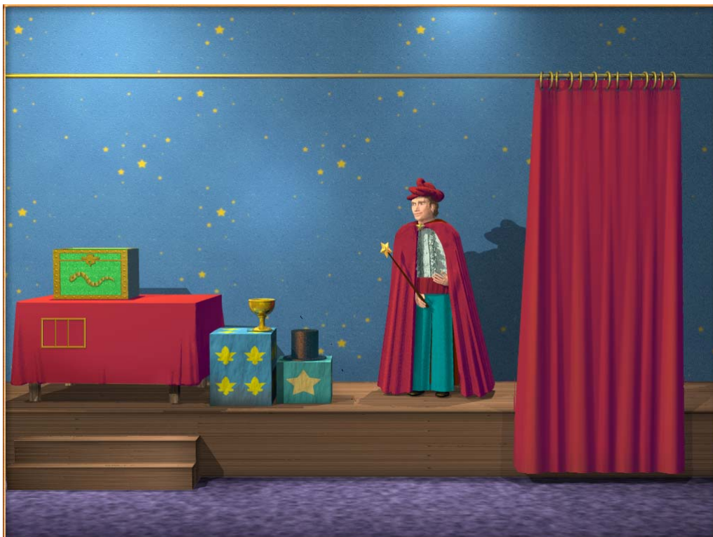
Εικόνα 1. Παράδειγμα άσκησης με αναγνώριση ομιλίας. Κάθε αντικείμενο αντιστοιχεί σε διαφορετική αποκλίνουσα εκφορά, ενώ στόχος είναι το πράσινο κουτί πάνω στο τραπέζι. Ο «μάγος» δείχνει κάθε φορά με το ραβδί ποια λέξη προφέρθηκε. Όταν ο στόχος επιτευχθεί όσες φορές έχει καθορίσει ο/η λογοπεδικός, το κουτί ανοίγει και δίνει μια οπτική ανταμοιβή.

Πληροφορίες για το OLP παρέχονται και από την ιστοσελίδα του έργου στη διαδικτυακή διεύθυνση http://www.xanthi.ilsp.gr/olp/ .