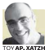
ΤΟΥ ΑΡ. ΧΑΤΖΗ

Υ πάρχουν διαφορές και ομοιότητες ανάμεσα στις πρόσφατες ταραχές στη Μεγάλη Βρετανία και σε εκείνες που ξέσπασαν στην Αθήνα τον Δεκέμβριο του 2008. Μία από τις σημαντικές διαφορές είναι η έλλειψη (στη βρετανική περίπτωση) αυτής της έστω επιφανειακής και ψευδοεπαναστατικής πολιτικής δικαιολόγησης των εξεγέρσεων. Στο Λονδίνο οι πυρήνες που οργάνωσαν τα επεισόδια δεν ήταν ακραίες αριστερές και αναρχικές οργανώσεις αλλά καλά οργανωμένες συμμορίες που δρουν εδώ και αρκετά χρόνια στις ίδιες περιοχές. Σε αντίθεση με την Ελλάδα, οι συμμορίες αυτές κυριαρχούν σε μεγάλο μέρος του Λονδίνου και άλλων πόλεων και πρόκειται να επανέλθουν σύντομα, μετά την αντεπίθεση της αστυνομίας, για να επαναδιαδικτήσουν την κυριαρχία τους. Υπάρχουν βέβαια και αρκετές ομοιότητες, όπως η αφορμή για τις ταραχές, η αρχική αδράνεια της αστυνομίας και της κυβέρνησης και η αμηχανία των πολιτικών κομμάτων. Στη βρετανική περίπτωση όμως όλοι συνήλθαν σχετικά σύντομα και η αντίδρασή τους φαίνεται να είναι αποτελεσματική.