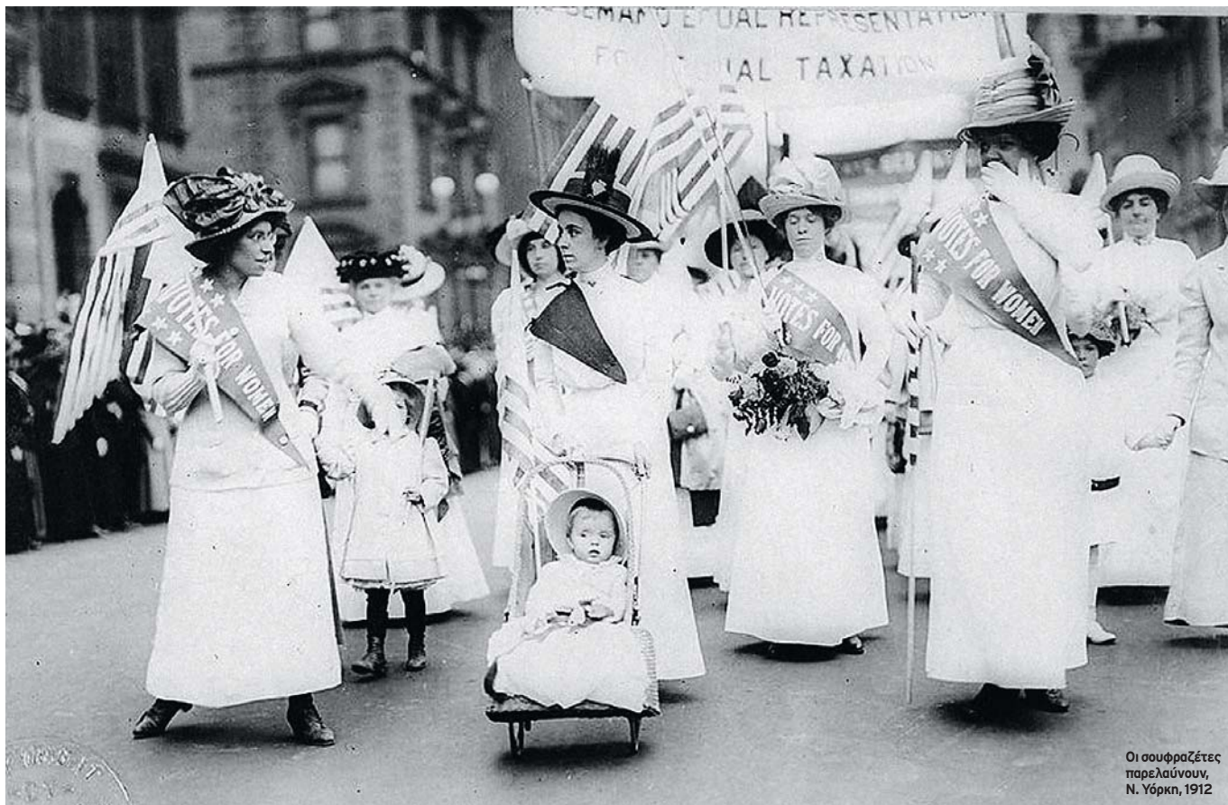
Οι σουφραζέτες παρελάυνουν, Ν. Υόρκη, 1912

>> και λεπτότητα που είναι σύμφυτες με το γυναικείο φύλο το καθιστούν ακατάλληλο για πολλές από τις ενασχολήσεις της ζωής μέσα στην κοινωνία. Η δομή της οικογενειακής οργάνωσης [...] δείχνει ότι η οικιακή σφαίρα είναι εκείνη που ταιριάζει περισσότερο στον προορισμό και στις λειτουργίες της γυναικείας φύσεως. Εν τούτοις, έναν αιώνα αργότερα, σημειώνεται μια σπουδαία μεταστροφή στη νομολογία του Ανωτάτου Δικαστηρίου. Στην υπόθεση Reed v. Reed (1971) αμφισβητήθηκε από τη Sally Reed το κύρος ενός νόμου της Πολιτείας του Αϊντάχο, ο οποίος για τον διορισμό στη θέση του «κηδεμόνα κληρονομίας» ( estate administrator ) έδινε προτεραιότητα στους άρρενες αιτούντες. Το δικαστήριο απέρριψε επιχειρήματα της Πολιτείας του τύπου λ.χ. ότι «οι άνδρες είναι περισσότερο εξοικειωμένοι από τις γυναίκες με τις επιχειρηματικές υποθέσεις», αποφαίνόμενο εν τέλει ότι η νομοθετική πρότιμηση υπέρ των ανδρών ήταν αυθαίρετη. Η απόφαση αυτή ακολουθήθηκε και από άλλες επιτυχείς αμφισβητήσεις του δόγματος των «χωριστών σφαιρών δραστηριότητας», το οποίο υπέσκαπτε τη θέση των γυναικών στην αμερικανική κοινωνία.