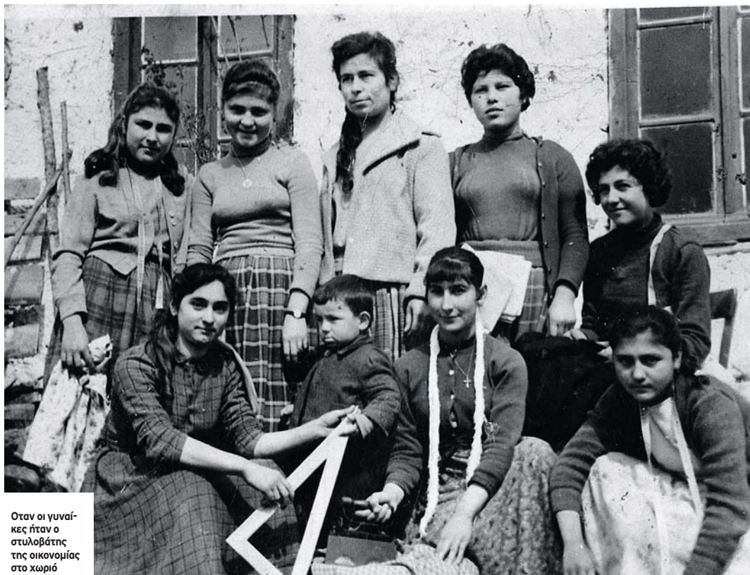
Όταν οι γυναίκες ήταν ο στυλόβάτης της οικονομίας στο χωριό

Αν ο γλωσσικός αποκλεισμός του γυναικείου φύλου από το νομοθετικό λεξιλόγιο λειτουργεί σε επίπεδο σημαινόντων και έχει συμβολική σημασία, η περιθωριοποίηση των Ελληνίδων από το περιεχόμενο των νομοθετικών κειμένων τις καθιστούσε «ολίγον πολίτες»